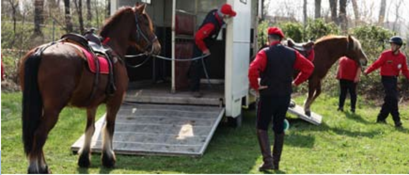
professionalità e sicurezza. Questa fase viene conclusa cronometrando i tempi di salità sul trailer dei cavalli.